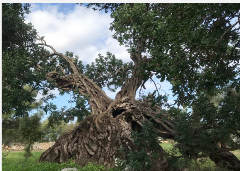
Fig. 2 – Esempio monumentale di Carrubo ( Ceratonia siliqua L.) presso Polignano a Mare (BA)